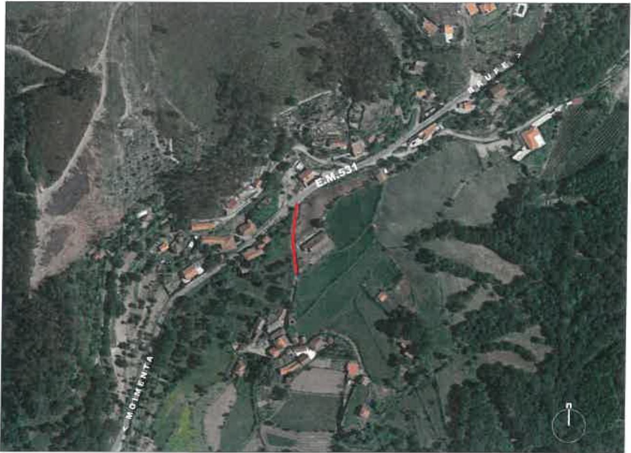
Extrato do Google Earth (atualizado)