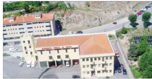
Gabinete está sediado no edifício dos Bombeiros Voluntários de Terras de Bouro

E, devido a situação atual relacionada com o covid-19, e tendo em conta os procedimentos de segurança e higiene, «é solicitado que seja efetuado previamente um telefonema para agendamento do dia e hora do atendimento (das 10h00 às 16h00 em dias úteis», finaliza a nota.