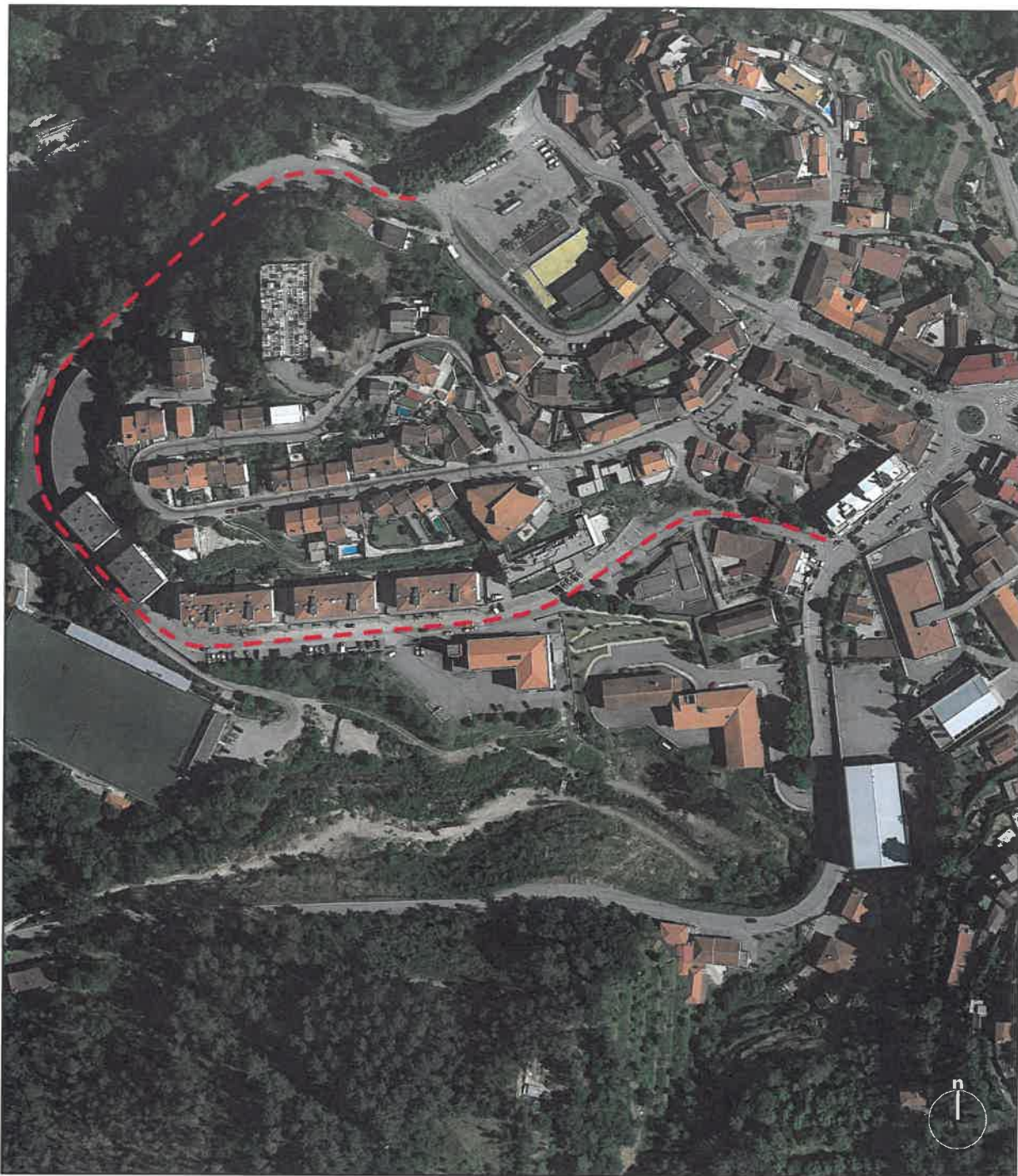
Extrato do Google Earth (e/escalas)