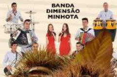
BANDA DIMENSÃO MINHOTA