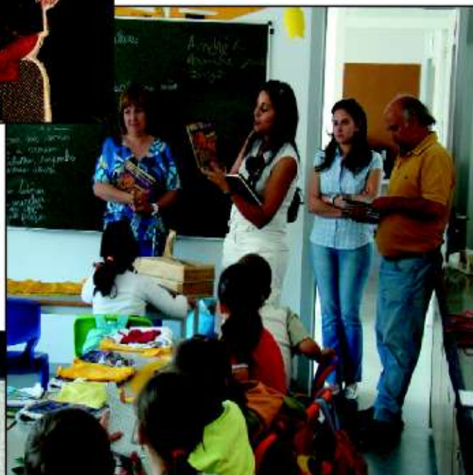
Apresentação e distribuição do livro nas Escolas