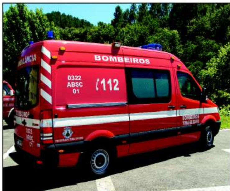
Ambulância oferecida pelo Município

A Câmara Municipal associou-se às Bodas de Prata desta Instituição, oferecendo uma nova ambulância que possui um equipamento moderno e eficaz na assistência a feridos e doentes. Deixamos aqui os nossos PARABÉNS a esta Instituição que tanto tem dignificado o nosso concelho.