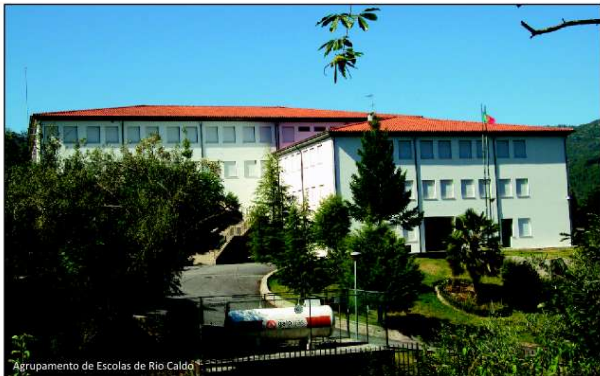
Agrupamento de Escolas de Rio Caldo

1. Preocupa-nos que o argumento utilizado (argumento que nunca nos foi oficialmente comunicado) para a fusão dos Agrupamentos seja a