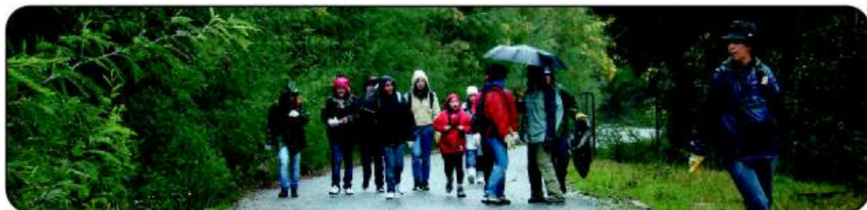
Trilho dos Miradouros

As “Caminhadas na Natureza” continuam a ser momentos importantes de divulgação do concelho.