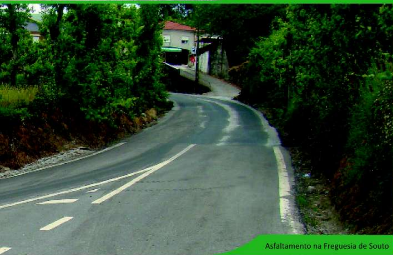
Asfaltamento na Freguesia de Souto