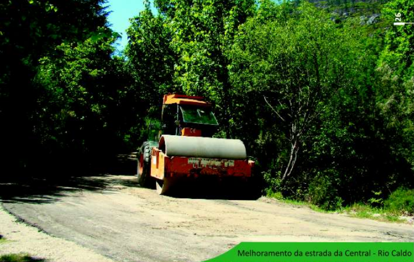
Melhoramento da estrada da Central - Rio Caldo