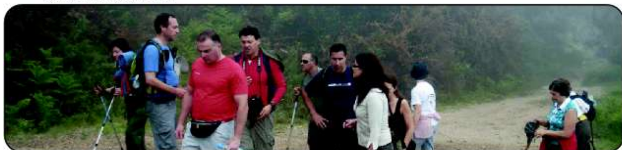
Dia Mundial do Ambiente