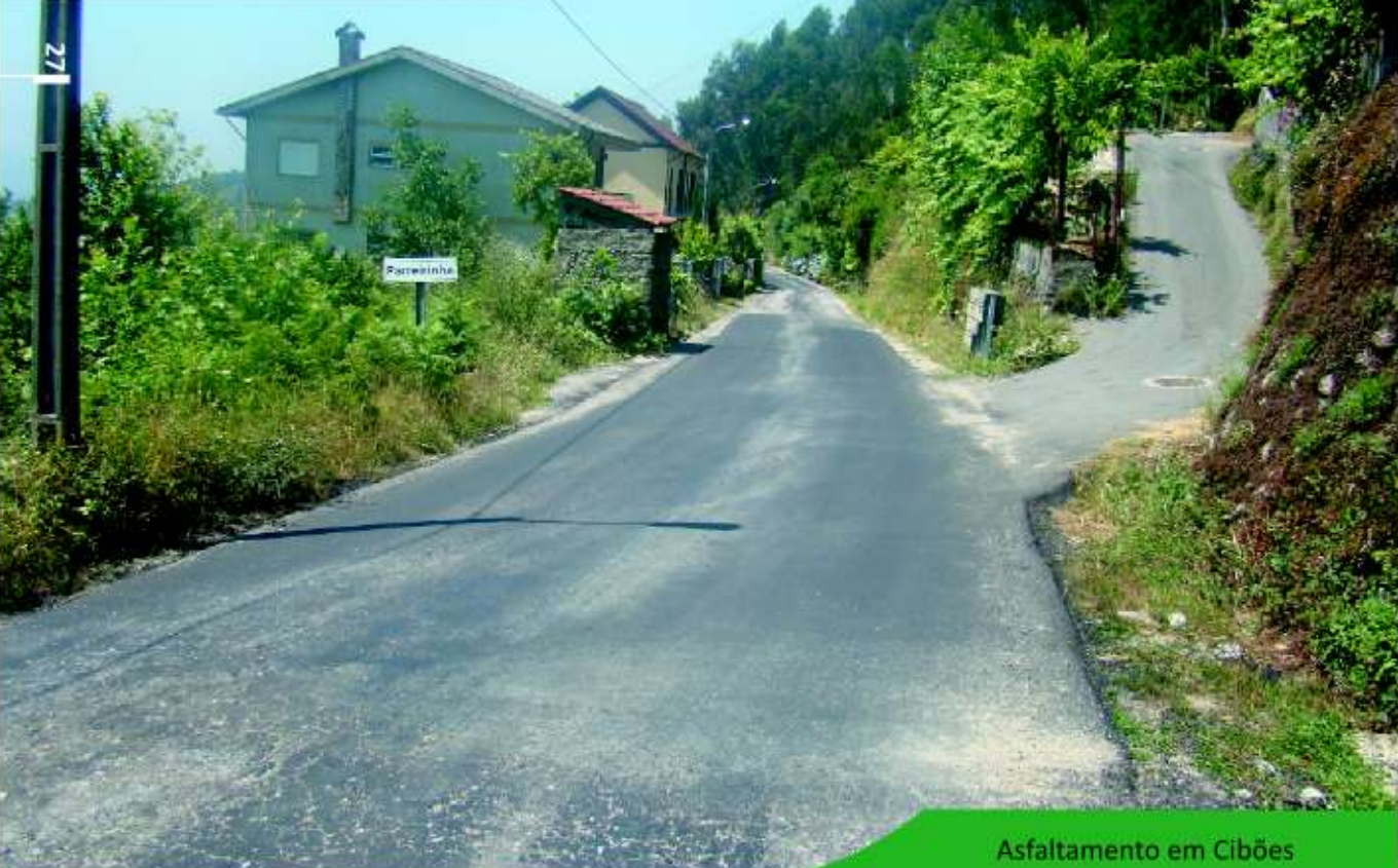
Asfaltamento em Cibões