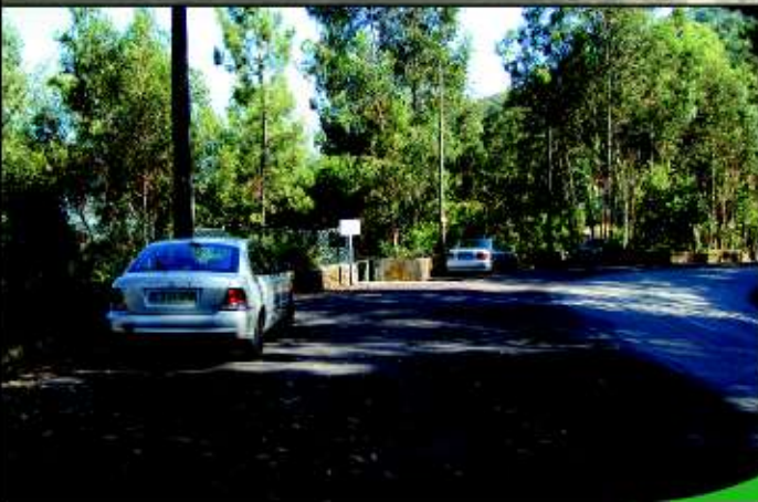
Criação de escapatórias e espaços para estacionamento em Vilar da Veiga e Rio Caldo