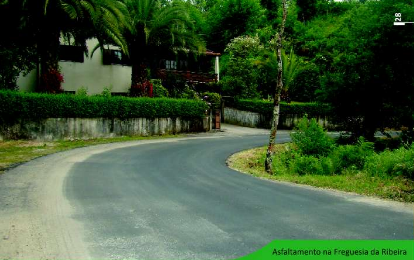
Asfaltamento na Freguesia da Ribeira