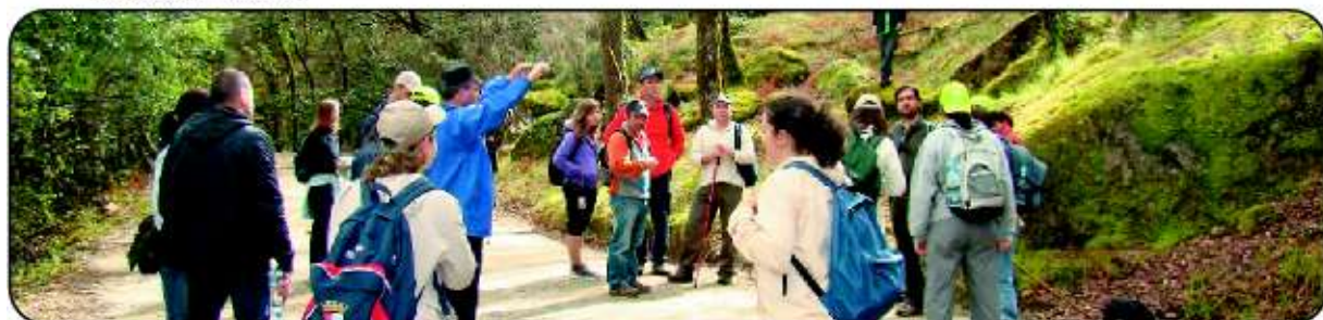
Dia dos Monumentos e Sítios