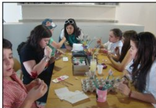
Crianças nos ateliers pedagógicos

Assim, no próprio dia, realizou-se, pela manhã, uma caminhada pelo “Trilho do Sarilhão” e, já da parte da tarde, teve lugar a inauguração da exposição de trabalhos escolares alusivos à “Água: cultura e património”. Realizaram-se também ateliers pedagógicos, ocorreu a actuação musical do Grupo Coral de Guadalupe e a entrega de prémios alusivos à exposição.