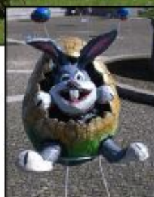
Prémio Público - Junta de Freguesia da Balança