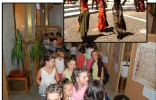
Exposição do Foral