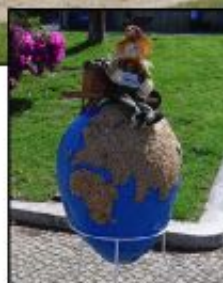
3º Prémio - Turma C EB P. Martins Capela