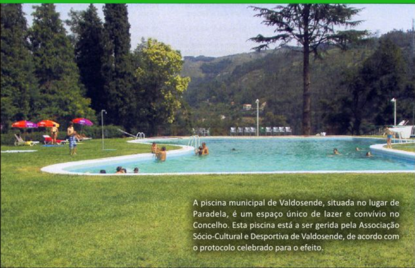
A piscina municipal de Valdosende, situada no lugar de Paradela, é um espaço único de lazer e convívio no Concelho. Esta piscina está a ser gerida pela Associação Sócio-Cultural e Desportiva de Valdosende, de acordo com o protocolo celebrado para o efeito.