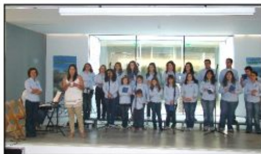
Vereadora dá as boas-vindas ao grupo coral da Guadalupe