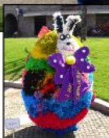
2º Prémio - Jardim-de-Infância de Carvalheira