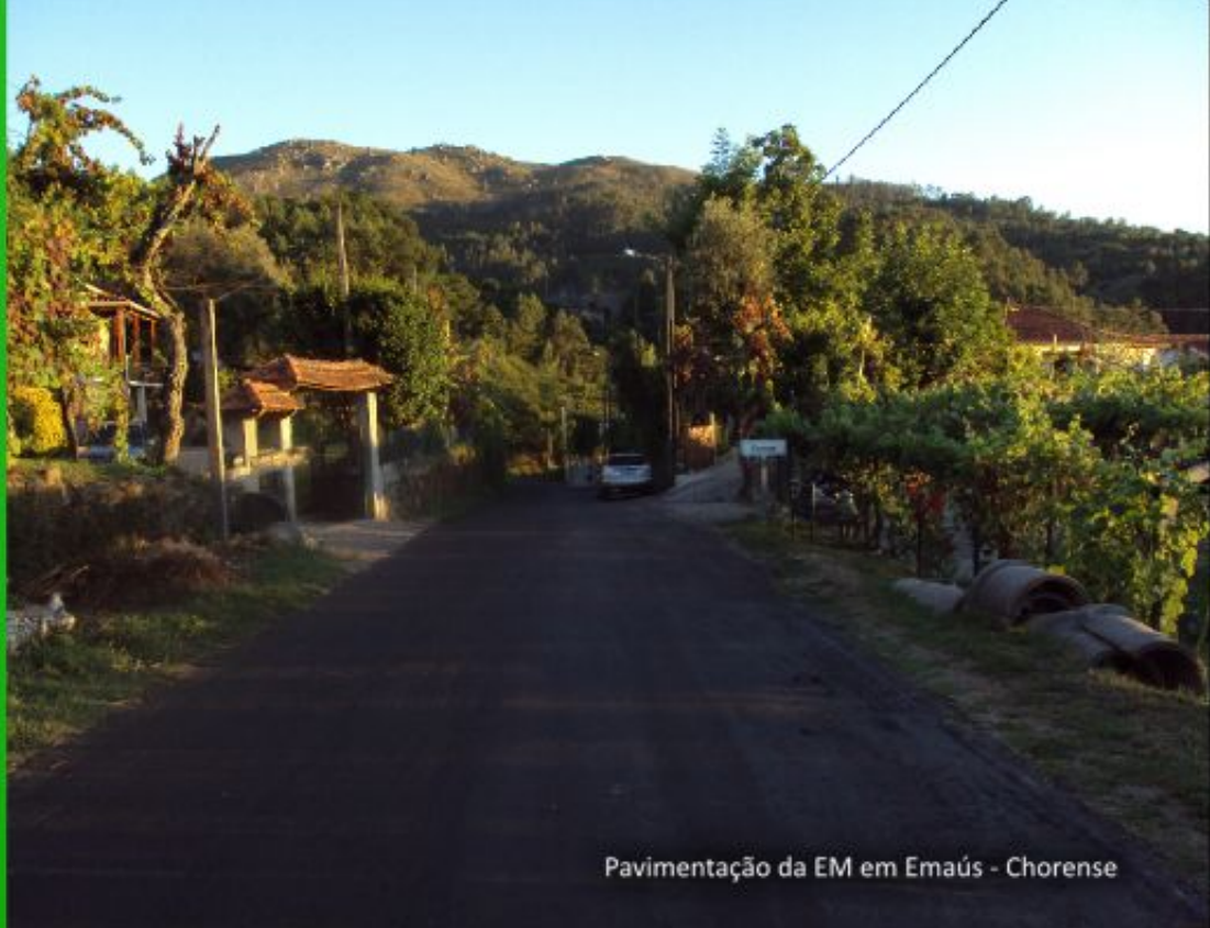
Pavimentação da EM em Emaús - Chorense