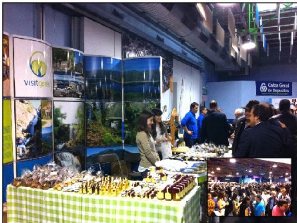
Stand de Terras de Bouro

“... A feira decorreu em Nanterre, local onde se encontra radicada a maior comunidade de portugueses em França ...”