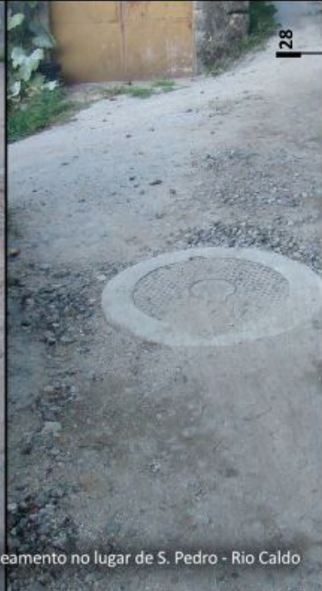
Rede de saneamento no lugar de S. Pedro - Rio Caldo