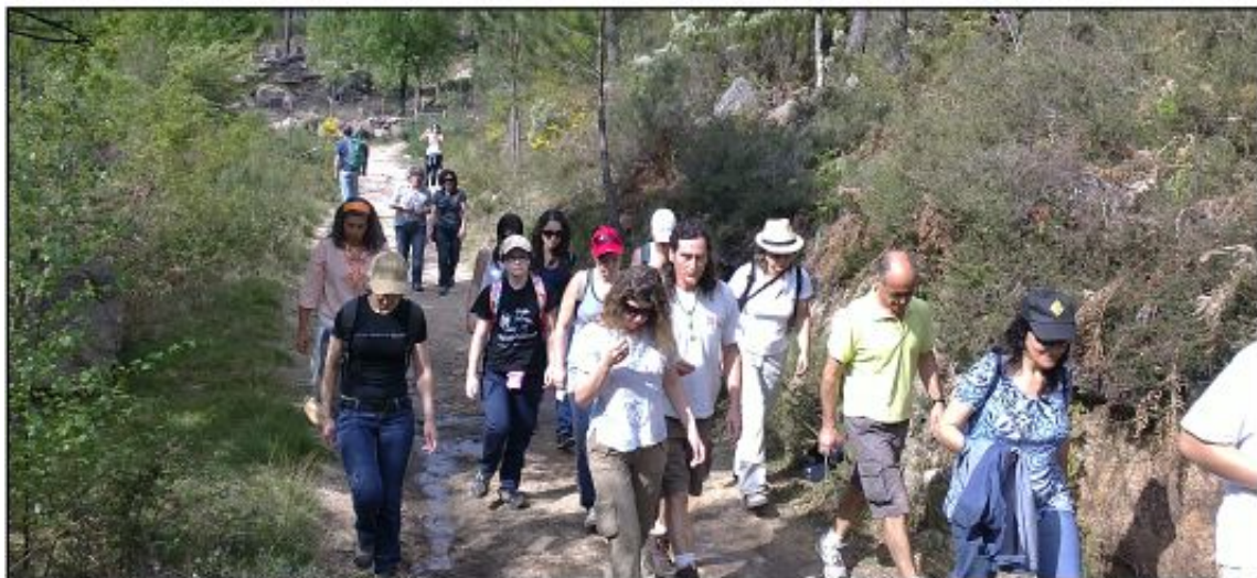
Caminhada junto à albufeira de Vilarinho da Furna