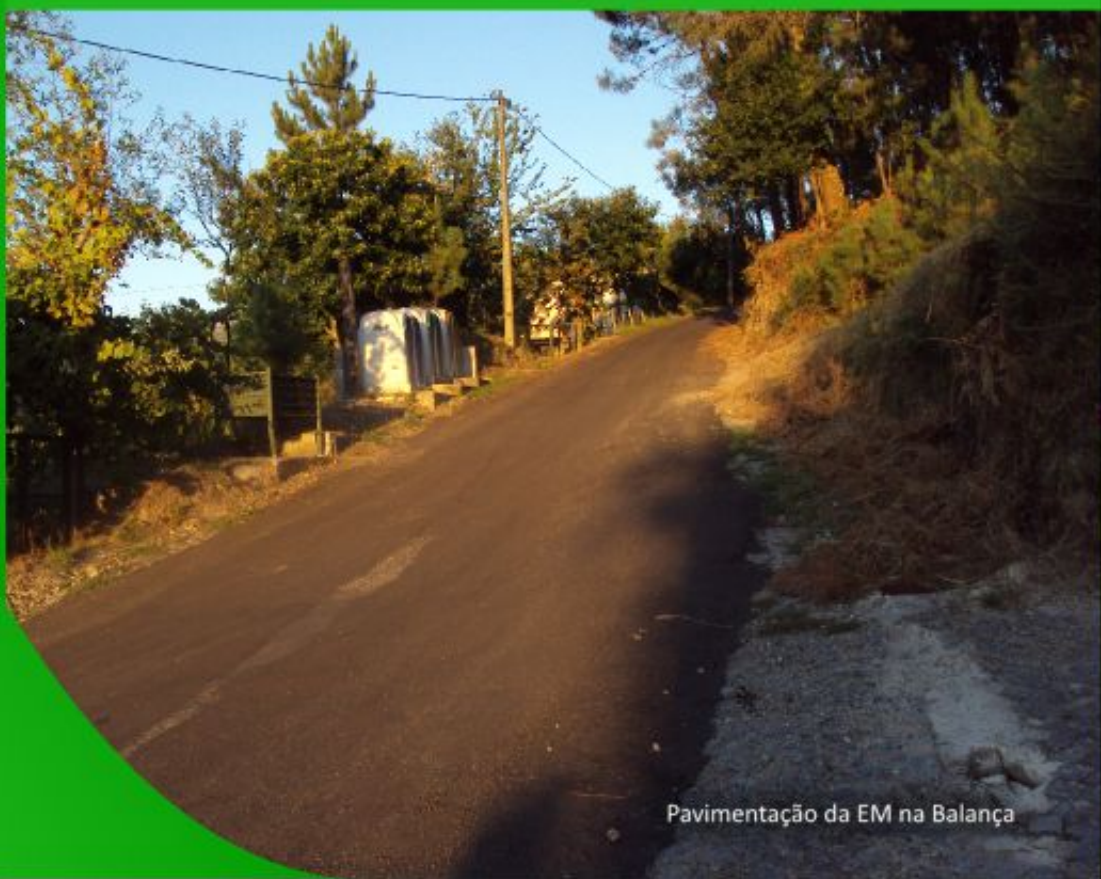
Pavimentação da EM na Balança