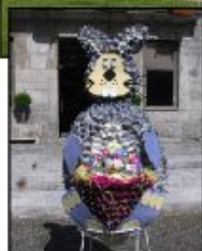
1º Prémio - Centro Social de Moimenta