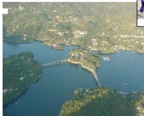
Ilberdo e Bóro

Entre as paisagens e segredos, a natureza, a flora e a geologia são minerais que se misturam ao solo e ao ar, criando um cenário único. Os rios e os lagos são o coração das Terras de Bóro, e a sua beleza é inigualável. A natureza é o grande protagonista, e a sua beleza é inigualável.