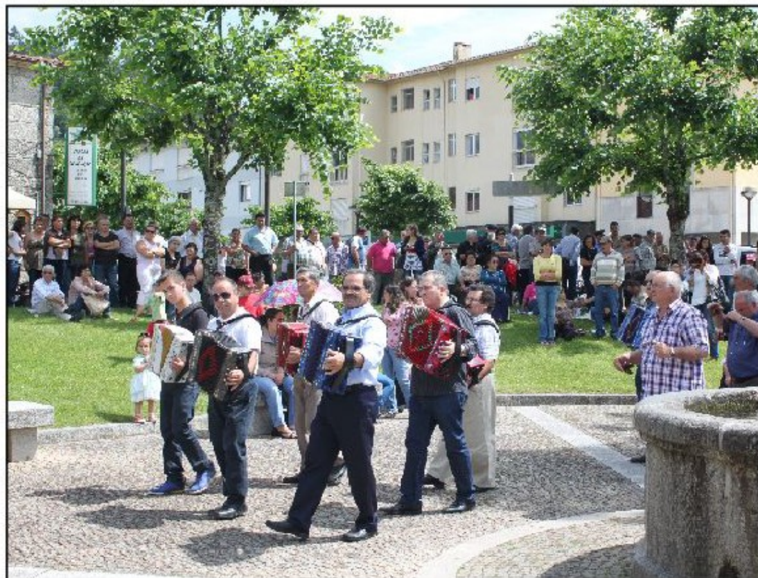
Entrada dos Tocadores de Concertinas de Terras de Bouro

“... O X Encontro de Tocadores de Concertinas e Cantares ao Desafio contou com a participação de tocadores de vários concelhos vizinhos ...”