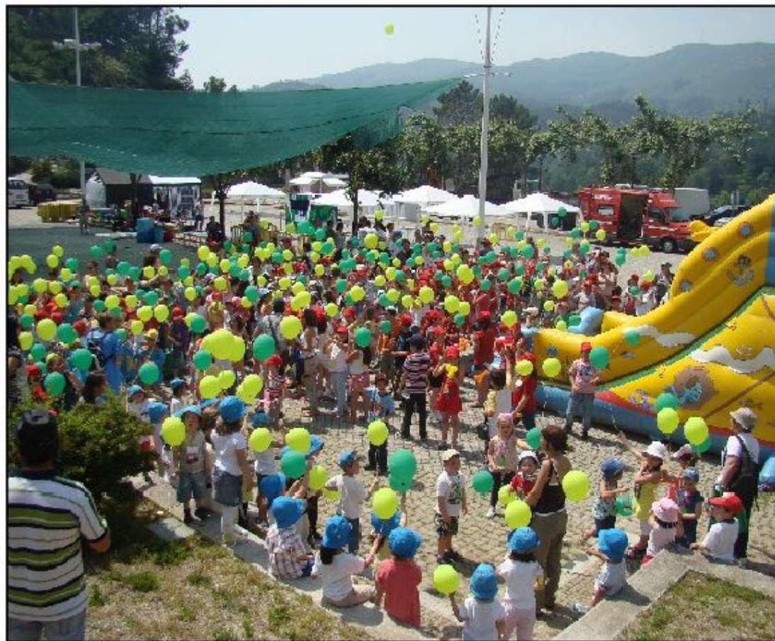
Alunos desfilaram pelas ruas da vila de Terras de Bouro

“... As ruas da vila de Terras de Bouro encheram-se de vida com as crianças e de colorido com a largada de balões biodegradáveis...”