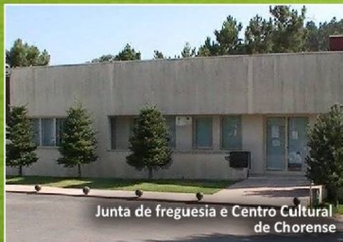
Junta de freguesia e Centro Cultural de Chorense

No final da sessão e por decisão unânime, relativamente à análise e discussão da Lei n.º 22/2012, (que aprova o novo regime jurídico da reorganização administrativa territorial autárquica), a Assembleia Municipal resolveu delegar nos membros da mesa e no senhor Presidente do Município a responsabilidade de encontrar um consenso entre as freguesias abrangidas pela nova reforma, assim como a apresentação de uma proposta sobre esta matéria na próxima reunião deste órgão.