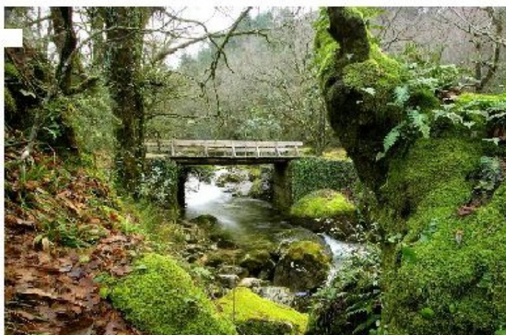
Ilberdo e Bóro