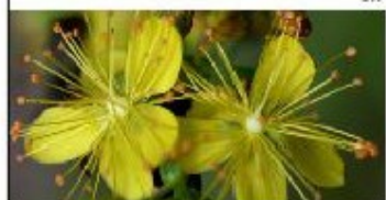
Tudo de Ilberdo