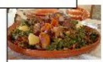
Ilberdo e Bóro

Entre as paisagens e segredos, a natureza, a flora e a geologia são minerais que se misturam ao solo e ao ar, criando um cenário único. Os rios e os lagos são o coração das Terras de Bóro, e a sua beleza é inigualável. A natureza é o grande protagonista, e a sua beleza é inigualável.