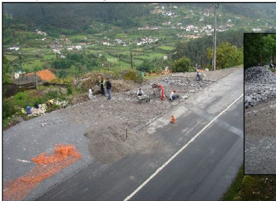
Pavimentação de sobranço no lugar de Paradela