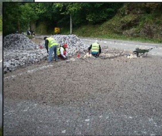
Pavimentação do futuro parque de merendas