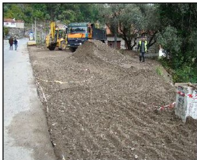
Pavimentação de sobranço no lugar do Assento

Quanto à implementação do trilho interpretativo da albufeira da Caniçada, na freguesia de Valdosende, urbanizaram-se os espaços de apoio ao trilho e iniciou-se a implantação do percurso incidindo nos sítios de interesse da referida localidade.