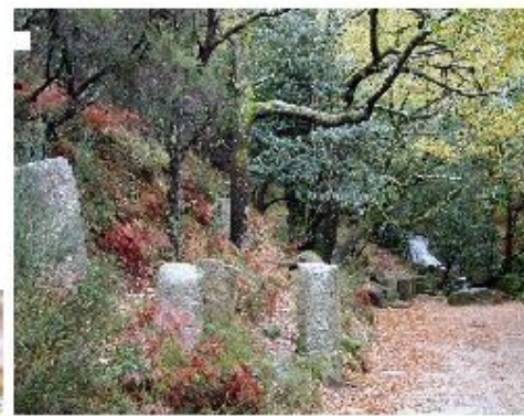
Ilberdo e Bóro

Entre as paisagens e segredos, a natureza, a flora e a geologia são minerais que se misturam ao solo e ao ar, criando um cenário único. Os rios e os lagos são o coração das Terras de Bóro, e a sua beleza é inigualável. A natureza é o grande protagonista, e a sua beleza é inigualável.