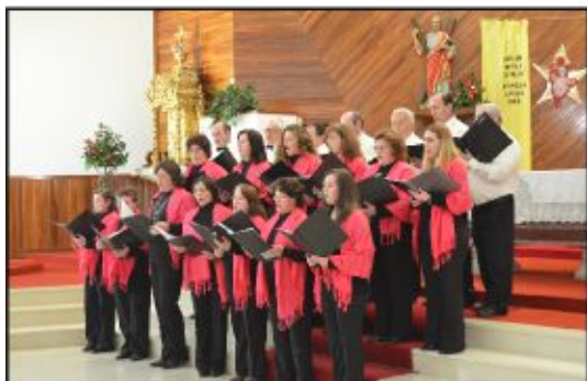
Grupo Coral de Souto