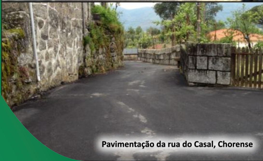
Pavimentação da rua do Casal, Chorense