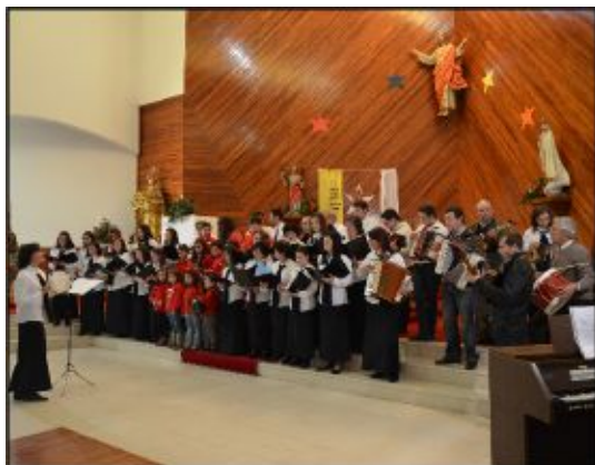
Crupe Coral de Chorense