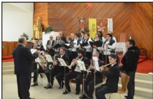
Grupo Coral de Carvalheira