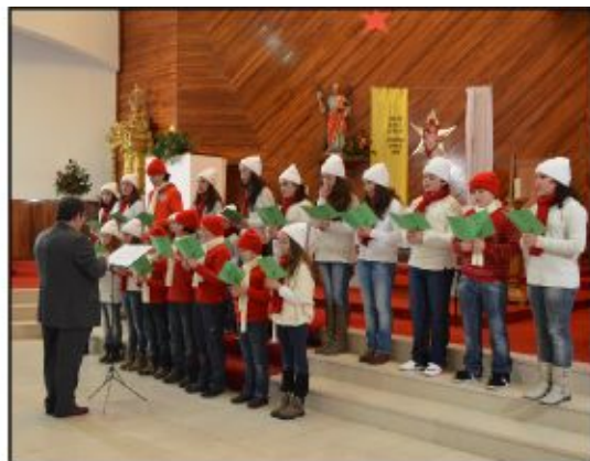
Pequenos Cantores de Moimenta