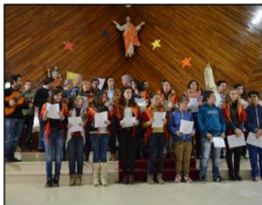
Ass. Sócio-Cultural e Desportiva de Valdosende - Paradela