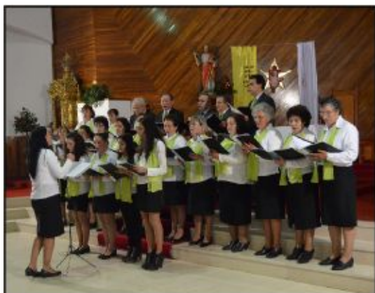
Grupo Coral de Cibões