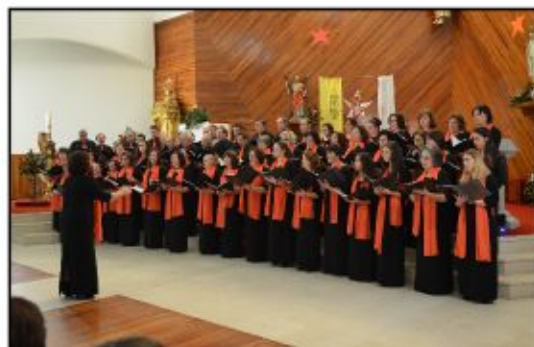
Orfeão de Terras de Bouro