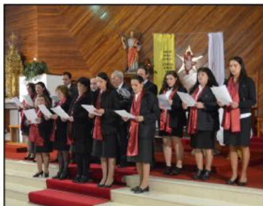
Grupo Coral de Gondoriz