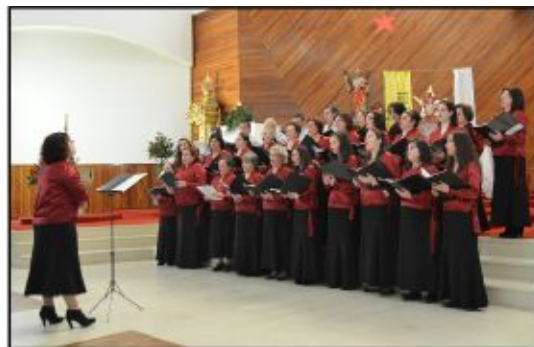
Grupo Coral de Moimenta