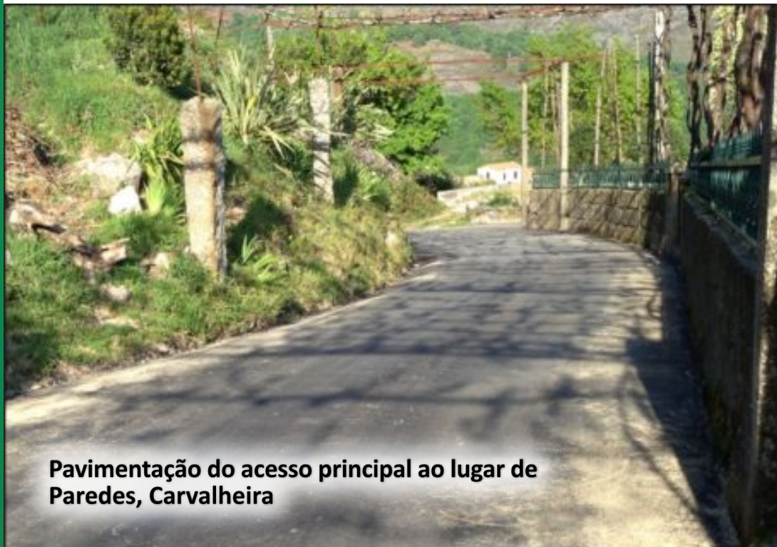
Pavimentação do acesso principal ao lugar de Paredes, Carvalheira