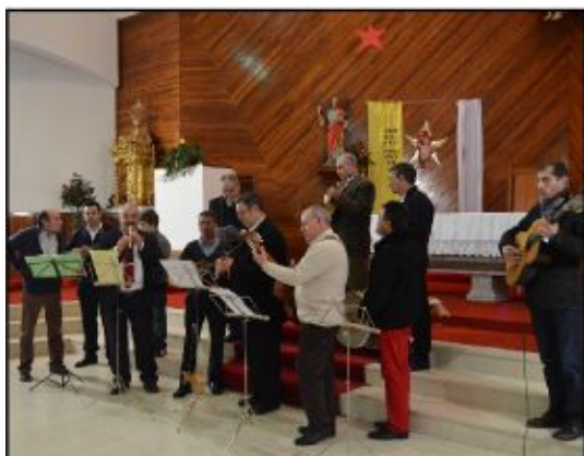
Grupo de Cavaquinhos e Violas da Ass. de Carvalheira