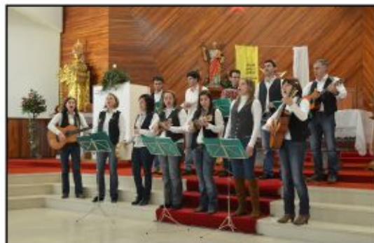
Grupo de Música Popular "Trevo Alegre"