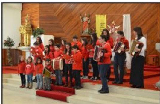
Coro Infantil de Chorense